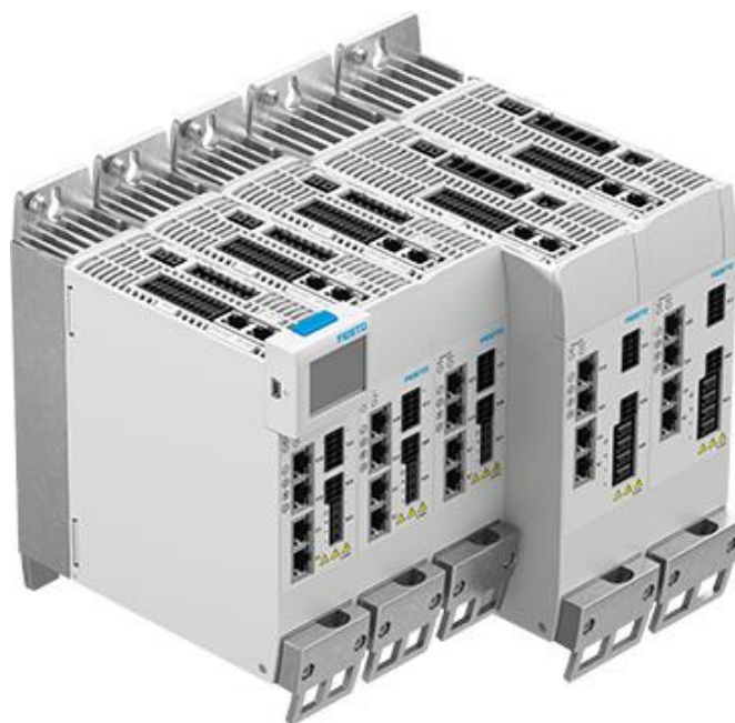
Servodrivsteget CMMT-AS upp till 2,5 kW och styrenheten CDSB som tillval.